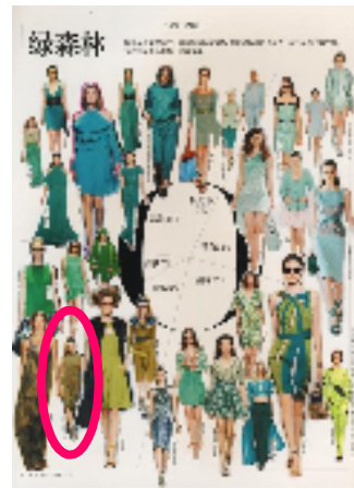
『L'OFFICIEL 5月号』(中国) ファッション誌 発行部数 約58万部