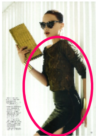
『AIR FRANCE MADAME 4月号』 (フランス)・ファッション誌 発行部数 約38.6万部