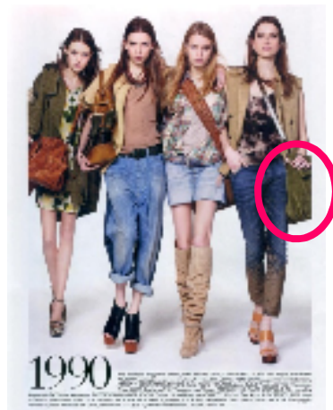
『マダム・フィガロ7月号』(ギリシャ) ファッション誌 発行部数 約3.9万部