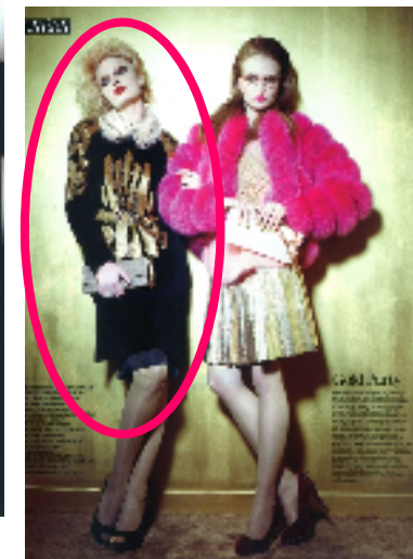
『ファッション・デイリー・ニュース4月号』(フランス) ファッション誌 *表紙にネックレス掲載