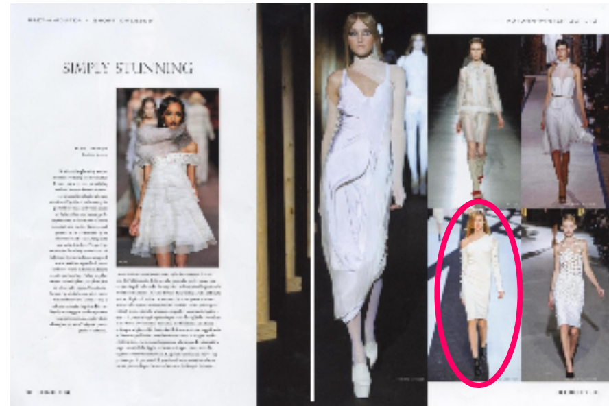
『COLLEZIONI SPOSA 6月号』(イタリア) ファッション(ウェディング)誌 発行部数 約1.8万部