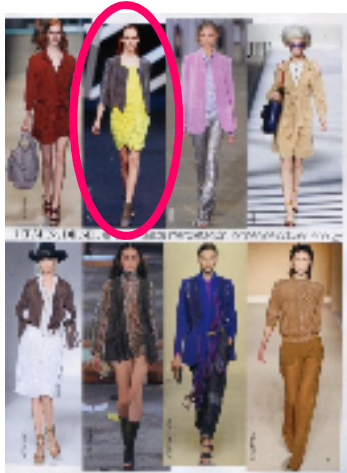
『VOGUE コレクションズ 5月号』 (スペイン)・ファッション誌 発行部数 約12.3万部