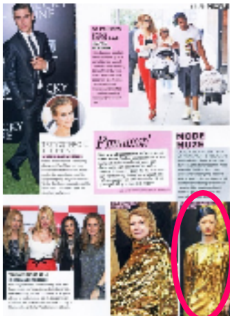
『GRAZIA 5月号』(オランダ) ファッション誌 発行部数 約9.3万部