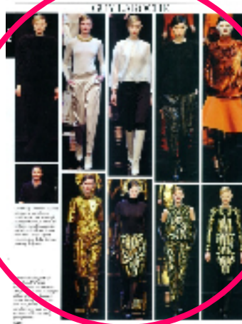
『VOGUE コレクションズ 5月号』 (フランス)・ファッション誌 発行部数 約16.6万部