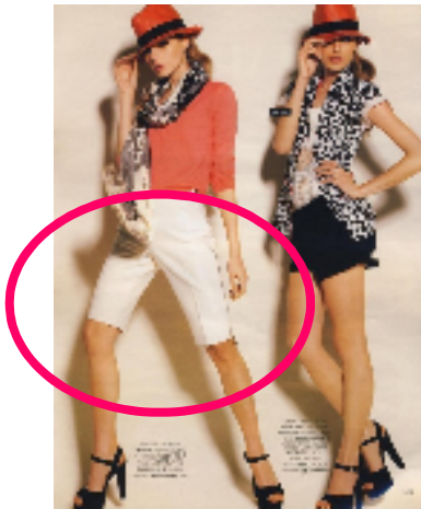
『マリ・クレール4月号』(ギリシャ) ファッション誌 発行部数 約4.6万部