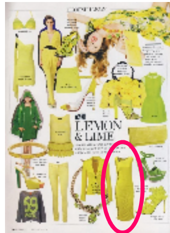
『L'OFFICIEL 4月号』(ギリシャ) ファッション誌